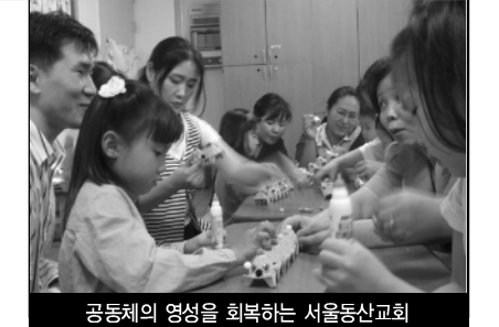
공동체의 영성을 회복하는 서울동산교회

조의 영이요, 거룩한 영이요, 진리의 영이요, 통달의 영이십니다. 성령께서 거하시고, 성령께서 지배하는 사람이 참된 영성의 소유자입니다. 우리에게 성령을 통하여 하게 하시는 외적인 사역이 3가지로 나타납니다. ①신령한 것을 분별하기 위해서입니다(13절). ②세상의 판단에 휘둘리지 않고 하나님의 판단 앞에 서도록 하기 위해서입니다(15절). ③성령의 권능으로 예수님을 증거하기 위해서입니다(15절).